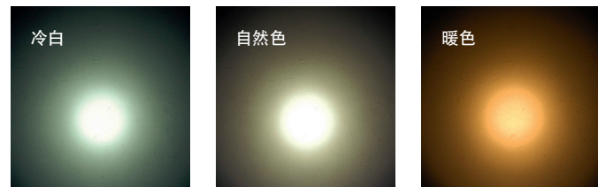
定制化的白光和色温