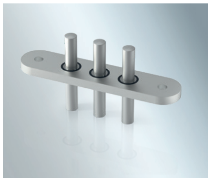
用于24 – 48 V应用的高电流需求

肖特还提供标准解决方案，或者可以设计和制造满足特定要求的定制产品。我们的CompRite®电子压缩终端生产设施已通过IATF (TS 16949) 认证。