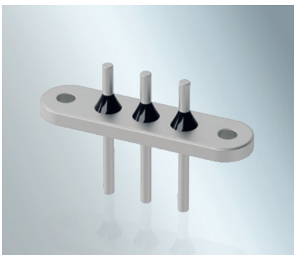
用于200 – 500 V应用